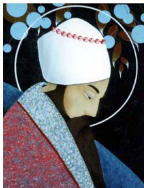
Guru Ram Das